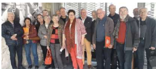
Les retraités de la SLR Couëron

Les retraités de la section locale de la CFDT étaient, mardi, en assemblée générale, à l'espace de la Tour à plomb. Représentés au centre communal d'action sociale, ils ont commenté les besoins sociaux à Couëron..