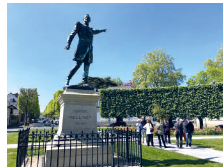
Surveillés par le général Mellinet !

Bonne promenade, bonne ambiance, bonnes explications. C'est à renouveler.